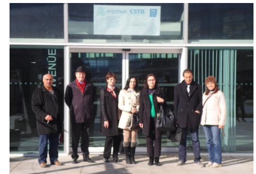
Photo du groupe participant à la visite