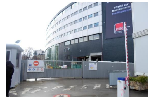
Chantier de la maison de la Radio Paris-France