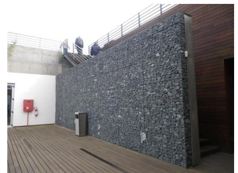
Cave à vin – Lisbonne- Portugal