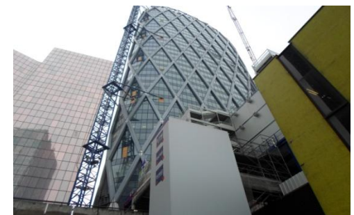
Chantier de la tour D2 Paris-France