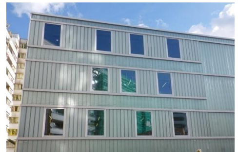
Restauration d'une bibliothèque interculturelle Berlin – Allemagne