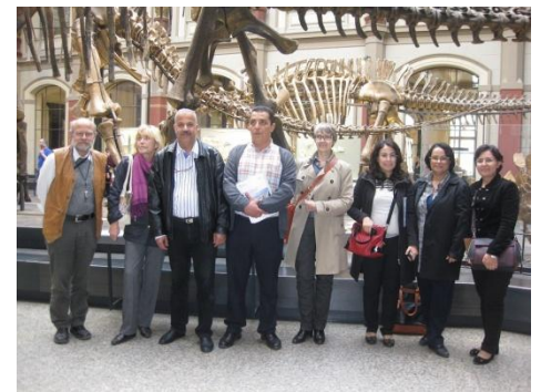
Groupes des cadres tunisiens participants à la visite avec les organisateurs allemands de la visite

Dans le cadre du jumelage éco-construction, une quatrième visite (3 jours à Lisbonne-Portugal et 2 jours à Berlin –Allemagne) pour 5 cadres de la DGBC a eu lieu du 21 au 25 octobre 2013. Celle-ci a permis de : -Visiter des bâtiments performants et des réalisations caractérisées par l'importance conférée à la prise en compte de l'éco-construction -Connaitre différents modes d'organisation et de gouvernance de services de construction publiques au Portugal et en Allemagne (mode de fonctionnement – dialogue de gestion....)